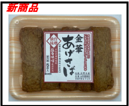
金華 あげさば 仙台味噌

「金華さば」を国産スケトウダラのすり身に最大限まで配合した惣菜タイプの揚げかまぼこ。調味には、岩手県「宮古の塩」を使用しています。産学連携商品