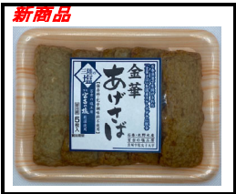
金華 あげさば 三陸の塩

北海道産スケトウダラ・ホッケ・ニシンを厳選使用し、化学調味料不使用で作りました。国産野菜と北国の魚の味と食感がお楽しみいただけます。産学連携商品