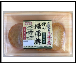
こだわり三種の魚 北の揚蒲鉾 野菜

北海道産スケトウダラ・ホッケ・ニシンを厳選使用し、化学調味料不使用で作りました。北国の魚の味と食感がお楽しみいただけます。産学連携商品