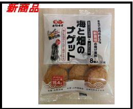
海と畑のナゲット 石巻どぶ漬唐揚げ味

「金華さば」を国産スケトウダラのすり身に最大限まで配合した惣菜タイプの揚げかまぼこ。調味には、仙台味噌を使用しています。産学連携商品