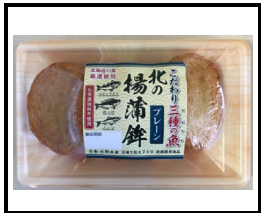
こだわり三種の魚 北の揚蒲鉾

〒986-0022 宮城県石巻市魚町2-5-3 TEL) 0225-96-3255 FAX) 0225-96-3253 メール) uminoneri@nifty.com