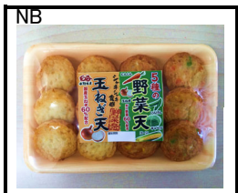
玉ねぎ天と 5種の野菜天