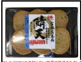
2021/9/28マツコの知らない世界で放送されました

石巻で昭和時代に生産されていた昔ながらの揚蒲鉾です。石巻産の新鮮な鯖とササニシキ米粉を配合しており、モチリ食感で甘みのあふれ揚蒲鉾です。産学連携商品